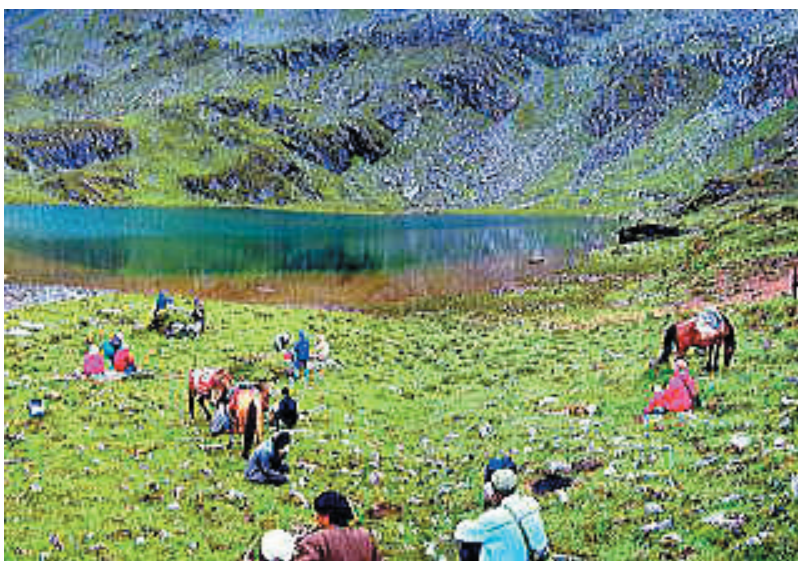
急登の更なる先のハイキング目的地 犀牛海子 / 4300 m