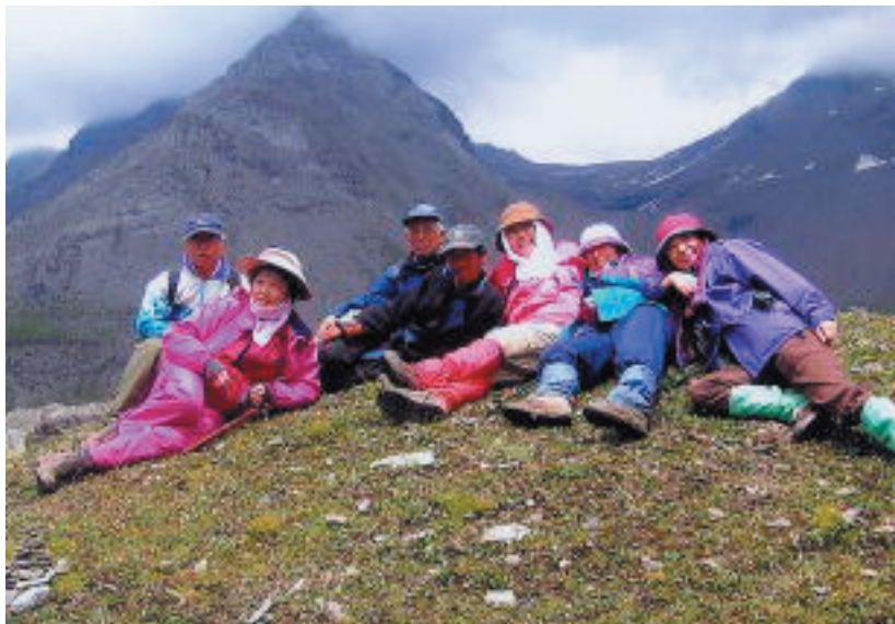
↑ 4,300 mの山頂で記念撮影