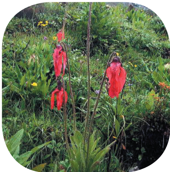
赤いがブルポピーの仲間