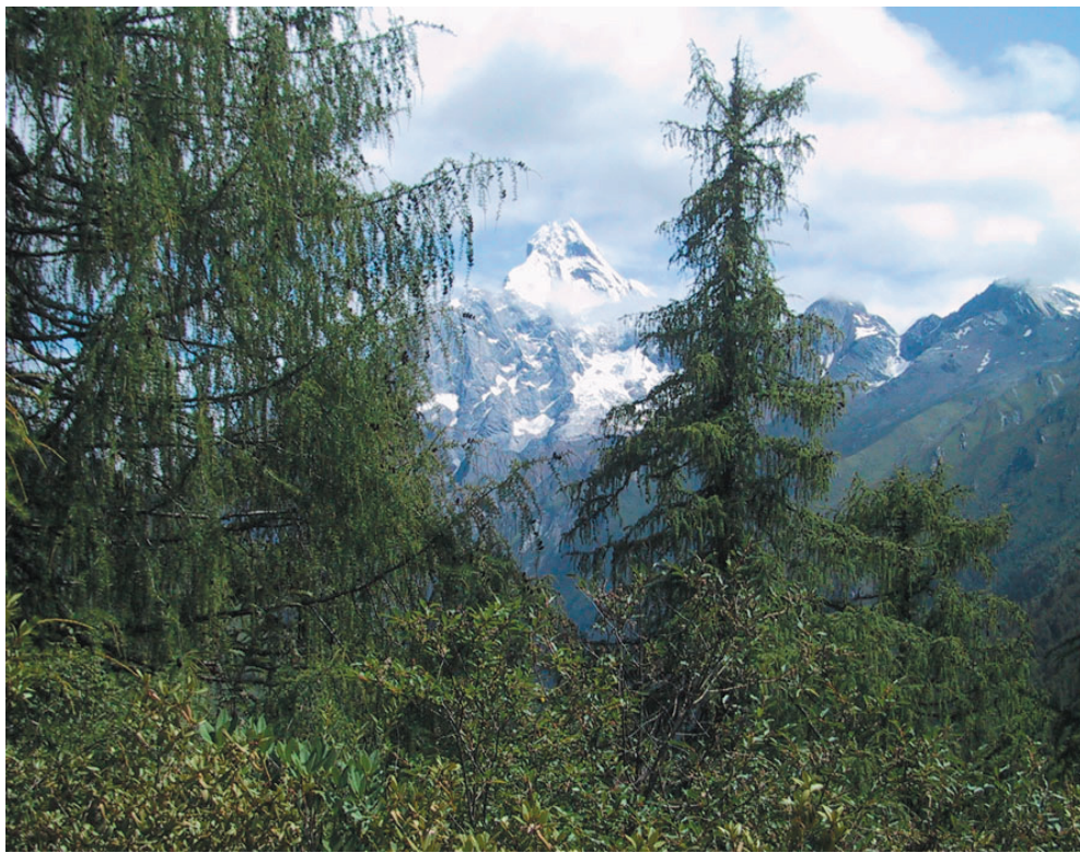
↑ 一瞬の晴れ間に全容を見せた四姑娘山 / 6250 m