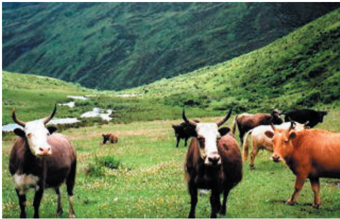
↑ テントを張った花海子は放牧された牛の楽園