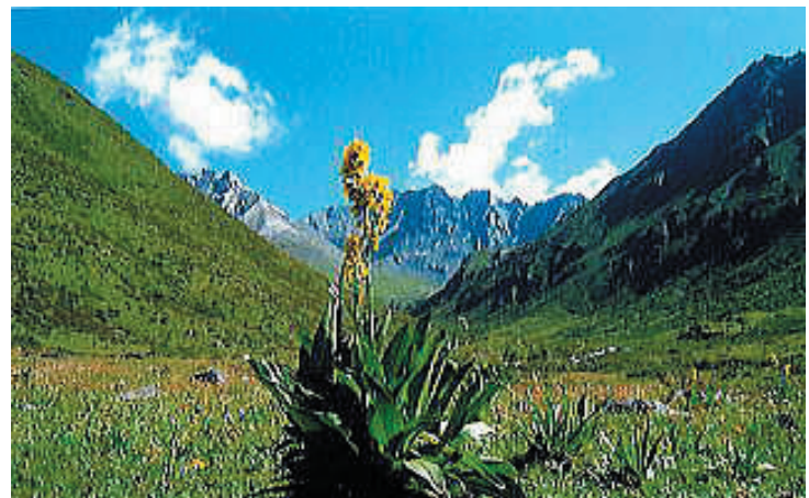
↑ 高さが 50 ~ 60 cm にもなる黄色いランの種類 海子溝の草原のあちこちに王者の風格で堂々と咲 いていた