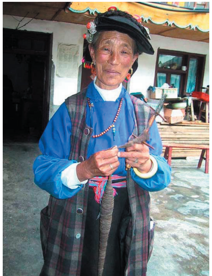
↑ 少年馬方さんと記念撮影