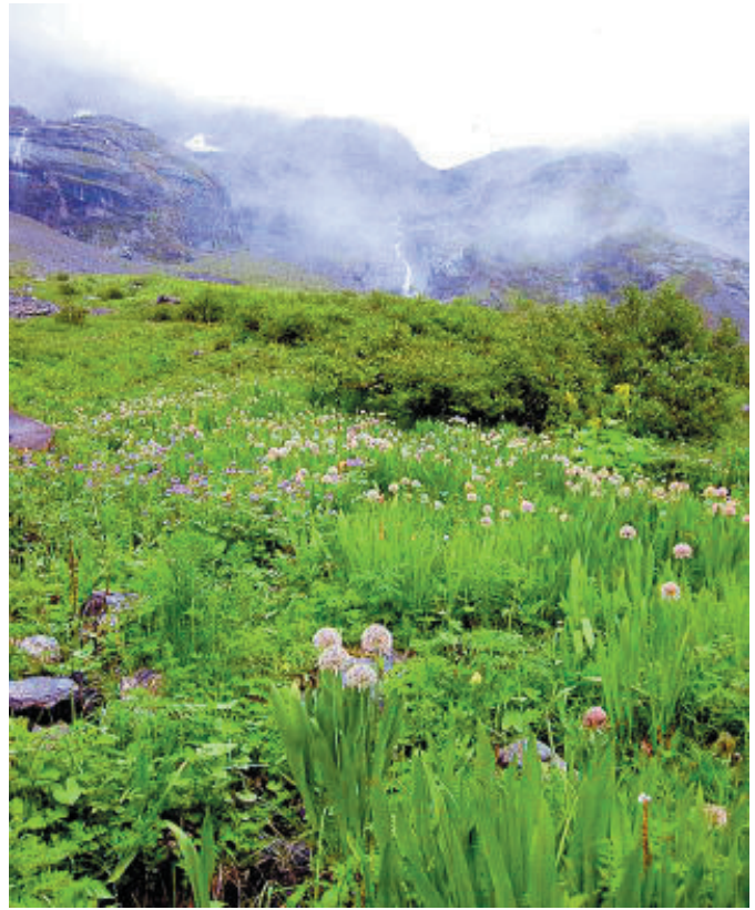
↑ お花畑の背景は懸垂氷河から流れ落ちる滝