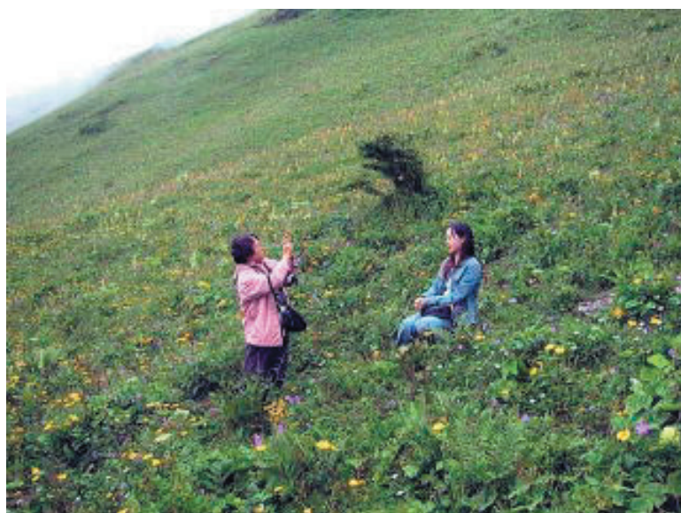
巴郎山の花の中でワンショット！