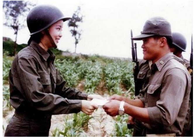
1981年、金門島で軍隊を慰問

この男と6年間同棲。彼女は1995年5月8日、静養先のタイのチェンマイでホテル住まいをして