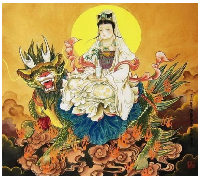
「観世音菩薩」のペットは「金毛狢」

まず修練を重ねたキョンシーは血と肉が消え、骨に異様な紋が現れます。百年後、異様な紋から白い毛が生え500年後黒くなります。さらに500年後黒い毛が金色になって行くのですが、ここからが大事なことになります。続いて1000年後、天地の理によって「雷劫」の洗礼を受けることになります。現世に有るまじきものが誕生することを、神聖なる雷によって浄化する目的ではないでしょうか。ほとんどの生き物はこの「雷劫」によって灰になるはずですが、この試練を生き延びたものは「天地が認める」ことになり、神様こと「仙(人)」になれるわけです。キョンシーも然り。「雷劫」から生き延びたキョンシーは晴れて「金毛狢」になれるわけです。「金毛狢」は、その字の通り金色の毛で覆われています。ただ首の付近に少しだけ白い毛が残っています。そしてその白い毛の部分は、「金毛狢」の弱みなのです。ある意味では必死の努