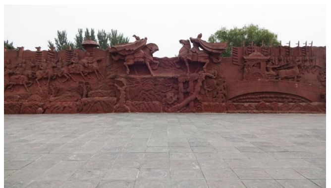
関公辞曹彫塑(2018年9月)

曹操と言えば、近年、中国考古学上の一大出来事に触れないわけにはいかない。2009年12月28日、中国中央テレビ局（CCTV）のニュースで曹操の墓の発見が報じられ、大きな話題を呼んだのである。場所は河南省安陽県西高穴村の農地である。その後『発見（発見）曹操墓』という4回シリーズのドキュメンタリー番組も制作された。それによると発見の経緯は