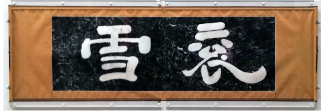
「衰雪」の拓本。特別展「三国志」（東京国立博物館）にて（2019年7月）

この曹操の墓の発見は、2019年の7月9日から9月16日に上野の東京国立博物館で催された日中文化交流協定締結40周年記念の特別展「三国志」の中心主題であった。私も7月15日に実際行って見たが「曹操高陵」の一部が原寸大で復元されているなど、