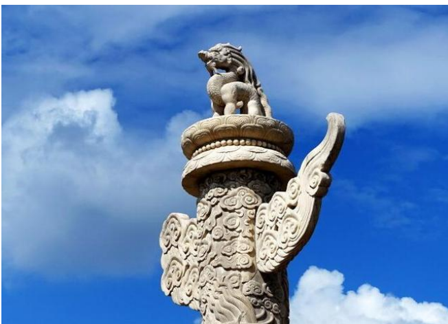
天安門前の華表

清朝の「故宮」には、3本の華表が立っています。天安門外の一本の華表に座っている「狐」は、「外」を向いています。これは国の権力者に遊びの心を収め、早く戻って国の正しい統治をするよう催促