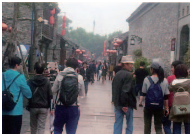
復元された清代街並み「東関街」

揚劇は、京劇や越劇(浙江省)、川劇(四川省)などの各地にある戯曲の一つである。江蘇省の揚州や鎮江などこのあたり一帯の地方劇である。「白蛇伝」などの演目は当然あるが、代表的な曲牌(元、明以降の曲調をいう)は、「梳粧台(化粧台のこと)」と出ているがまだ見たことがないので説明はできない。揚劇はいつのころから行われているのか定かではない