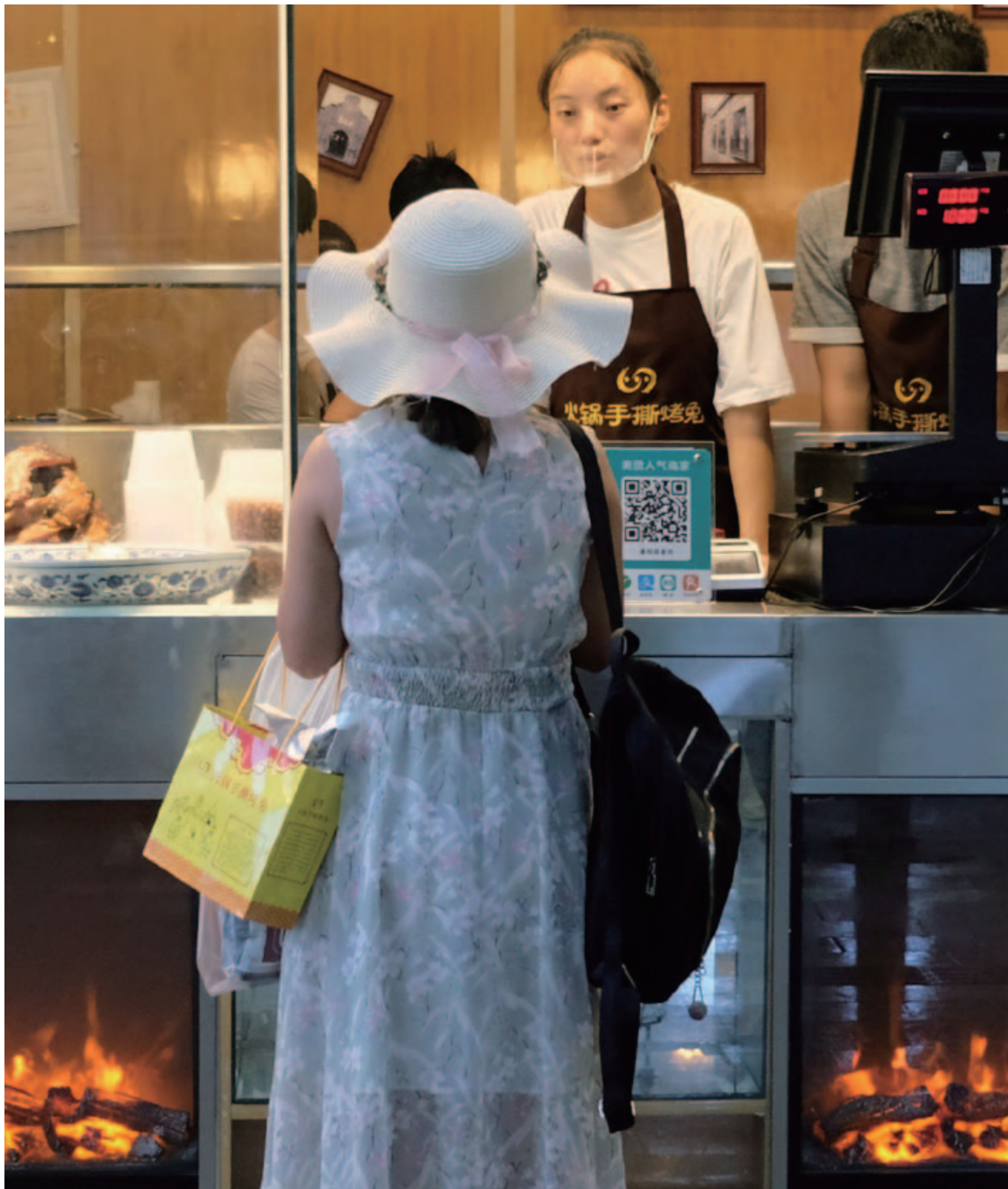
成都のウサギ焼き肉屋(火鍋手撕兔) 四川省成都是若者で活気に満ちている。夜になると、飲食店はどこも大賑わい。明るい照明につられて覗いた店はウサギの焼肉屋、お持ち帰りの店だった。通りに面してガラス越しに炎の列がすごい。ウサギ肉は普通に食べられているのか。 (2018年7月、四川省成都にて)