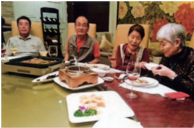
5都市とグルメ×5日間」のツアーだけに、毎日豊富な多彩な料理が出た。

が、2006年に「国家級非物質文化遺産」(国の無形文化遺産のこと)に登録されている。中国は各地で伝統芸能が盛んである。昨年10月に四川省の宜賓市に行った時、広場で「李庄草龍舞」に出くわしたことがある。この舞は「四川省非物質文化遺産」に指定されているとのことであった。