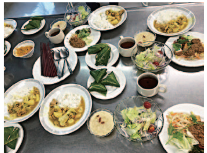
もうすぐランチですよ～