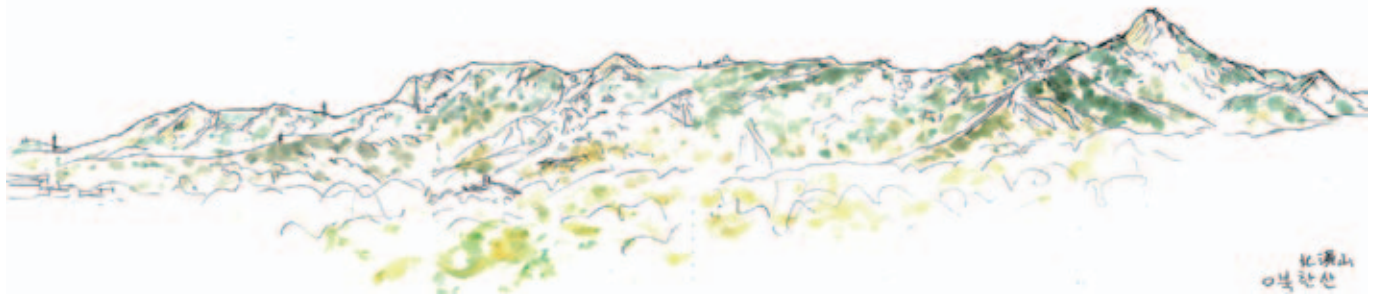
北漢山(筆者スケッチ)

そこには2人の軍人の銅像(朝鮮戦争で功のあった?)があった。バス停すぐ横の階段を上ると彰義門 チャンイムン に出る。詰所の男性にデジカメを見せて写真を撮りたいとジェスチャー、彼は門をくぐった先に案内して、ここからなら門額が入ると教えてくれた。彰義門案内所は9:00から、「北岳山ソウル城郭探訪」出入り申請書を記入してパスポートを提示、貰った許可証を首にかけて9:10入場する。左側は石造りの城壁、真ん中に段差の大きい石段、右側は手すり柵、柵の外はかってそこを歩いて登れたと思われる踏み跡が続く。柵の際に白い小花が手毬状に集まった花房をたくさんつけた野草が目につく。日本では見たことない。帰国後調べたらマルバフジバカマ(北米原産)だった。日本では西の地方にあるフトボナギナタコウジュもあった。日本で見るより花が大輪のノギクが数種類あった。足元の花を数えながら階段登りに励む。右手内側の山麓には青瓦台 チョンワデ があるため目隠し板が続く。左手、城壁越し、付岩洞 フアムドン の街並みの先には緑の山肌に白い花崗岩の頂というたおやかな峰々が連なり、右端がぐんと高まった山が北漢山 フカンサン だろう。そんな景色をスケッチに収める。