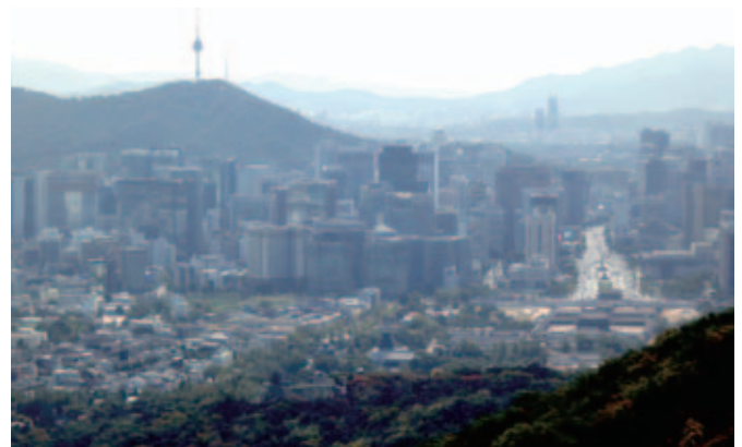
曲牆から景福宮と世宗大路(右下)を見下ろす

ホテルのある鍾路3街駅へは空港鉄道を孔徳で地下鉄5号線に乗り換えるのだ。孔徳までの空港鉄道普通電車1回券を購入(4,150₩+保証金500₩)、地下鉄の乗換は路線番号と路線色の表示を見ながら歩けば問題ない。鍾路3街駅の6番