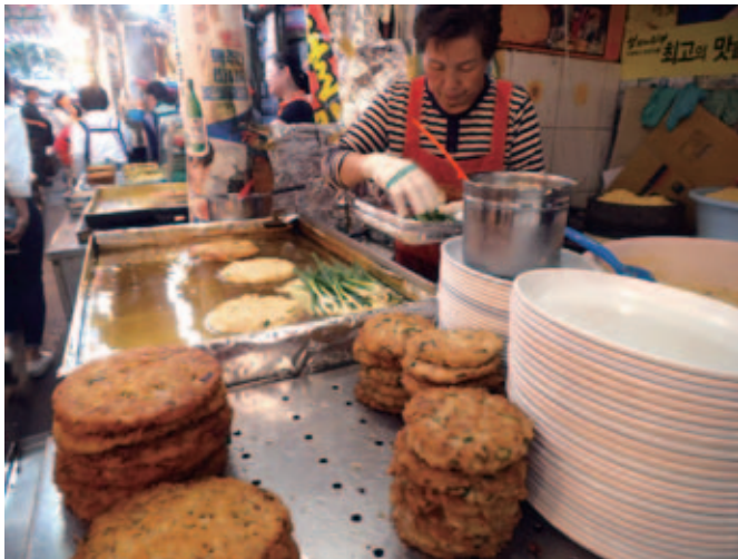
広蔵市場のチヂミ店