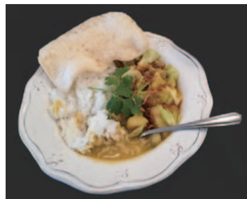
インドネシアカレーはえびせんが付く

今回使用の香草：上から香菜(パクチー)、コブミカンの葉、レモングラス、バナナの葉(レモングラスの下の葉)、カー(生姜状の根っこ)、パンダンの葉(香と色付けに使用する)