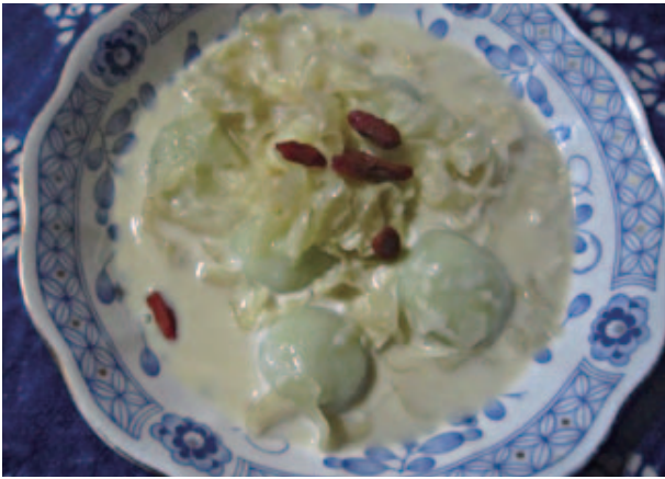
白きくらげとパンダンの葉で色付けした白玉団子のココナッツ味のデザートパンダンの葉の香りが爽やかだ