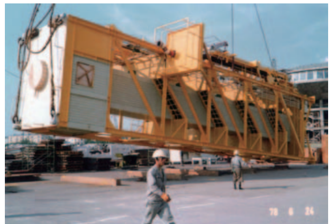
ギャングウェイの垂直に立てる作業です。一番の見せ場でした。

そんなある日、事件が発生したのです。夜の10時頃保温屋さんの責任者が私の部屋に入って来ました。まだ3人寮に帰ってきません、との報告です。