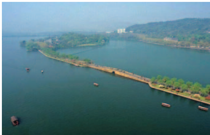
杭州西湖蘇堤と周辺景色（百度百科から）