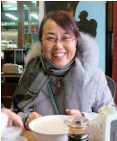
筆者。太原の老舗焼麦屋「清和元」で。 2017年2月

ぜたものです。それを水甕の表面に擦りつけますが、一粒一粒の粟粒が飛び出てそんなに滑らかではありません。まるで綺麗な娘さんの顔のあばたのようでデコボコしています。でも米次粉を水甕から剥がし、細く切って糸のようにしたところにタレをかけたその味は本当に美味しいものでした。豆麺の柔らかくて滑らかな舌触り、粟の清々しい香り、タレのさっぱりとした味わい、これこそが炎天の夏の醍醐味でした。