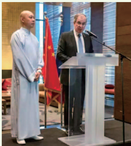
北京のフランス大使館での授与式

4月8日に開催された「果敢二胡リサイタル2016」にお越し頂き、加えて温かいご支援も頂き心から御礼申し上げます。パリに無事に戻り、早速、ジャズヴァイオリニストとのコンサートを行いました。日本の皆さまから頂いた勇気と感動を忘れることなくこれからも精