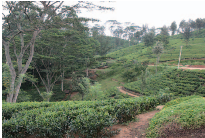
標高 2000 ~ 2500m 級の山々が連なる高原地帯。ヌワラエリアの紅茶畑

である。それにしても、当地域の生産量はセイロンティーの約半分を占めているとか。おみやげにいただいた紅茶は黒っぽい茶葉で水色(すいしょく)は赤茶色を帯びてみえた。ミルクティーにマッチする。もしかして、肥料も関係するのでしょうか？ 私は足を下ろし