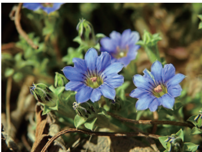
真っ先にハルリンドウ

( http://rgyalmorong.info/scholaweb/queenvideo-j.htm )