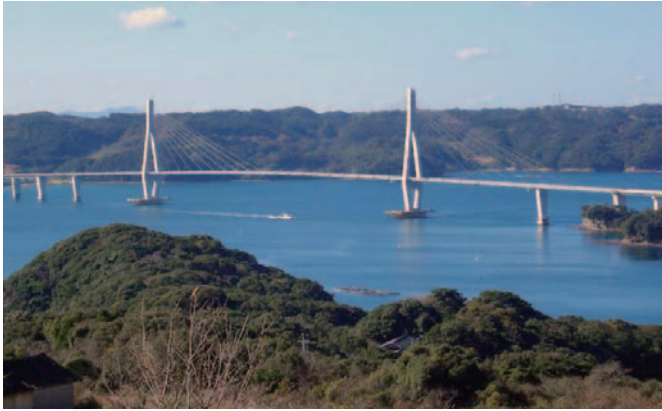
鷹島肥前大橋