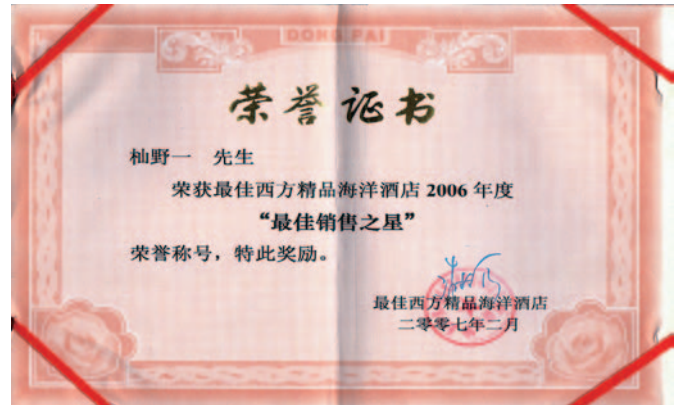
「海洋酒店」の売りに功勞したことへの荣誉称号を受ける

実は、ホテルがオープンした当初は日本人は少なく、ヨーロッパからの人々が多く来ました。それでかどうかはっきりしませんでした。何故か何種類ものパンの中でフランスパンだけが、毎日早朝から焼くのですが、焼いても焼いても足りません。それで食堂の様子を見てみると、ホテルの客たちがフランスパンにハムやベーコンをはさんで昼食の分まで持って行ってるということが分かり、その後いろいろ対策を考えて、フランスパンが誰にでも行き渡るようにしました。まあ、そんな事などいろいろありましたが、食パン、バターロールなどもお客さんたち