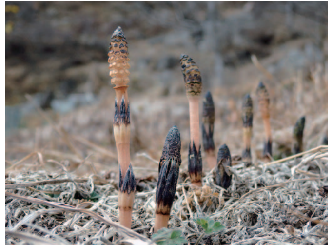
水気の多い所ではツクシ

町から川に沿って標高を400m位下げると桃の花が満開で、更に400m位下がると梨の花が満開、更に400m位下がると林檎の花が満開です。春は川に沿っ