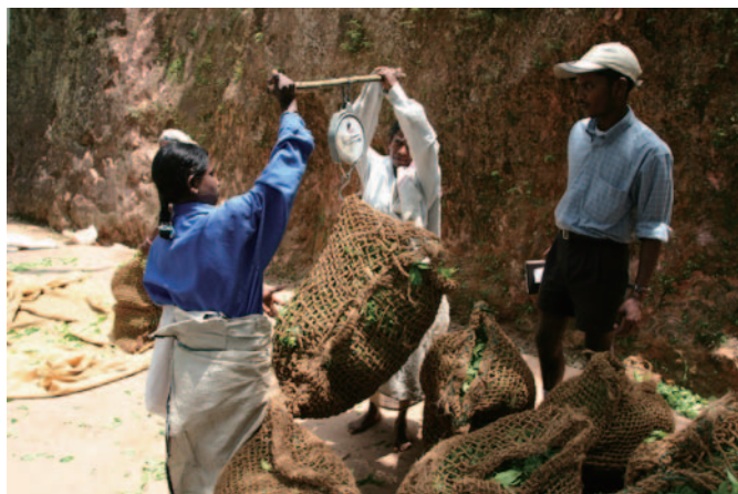
ヌワラエリアの紅茶プランテーションにて

スリランカの国で生産されているのに、誰もが「セイロンティー」と呼称するのを耳にする。現在はスリランカの主要輸出品となって、輸出額は第2位であると聞いている。ゴムやココナッツの三大ブ