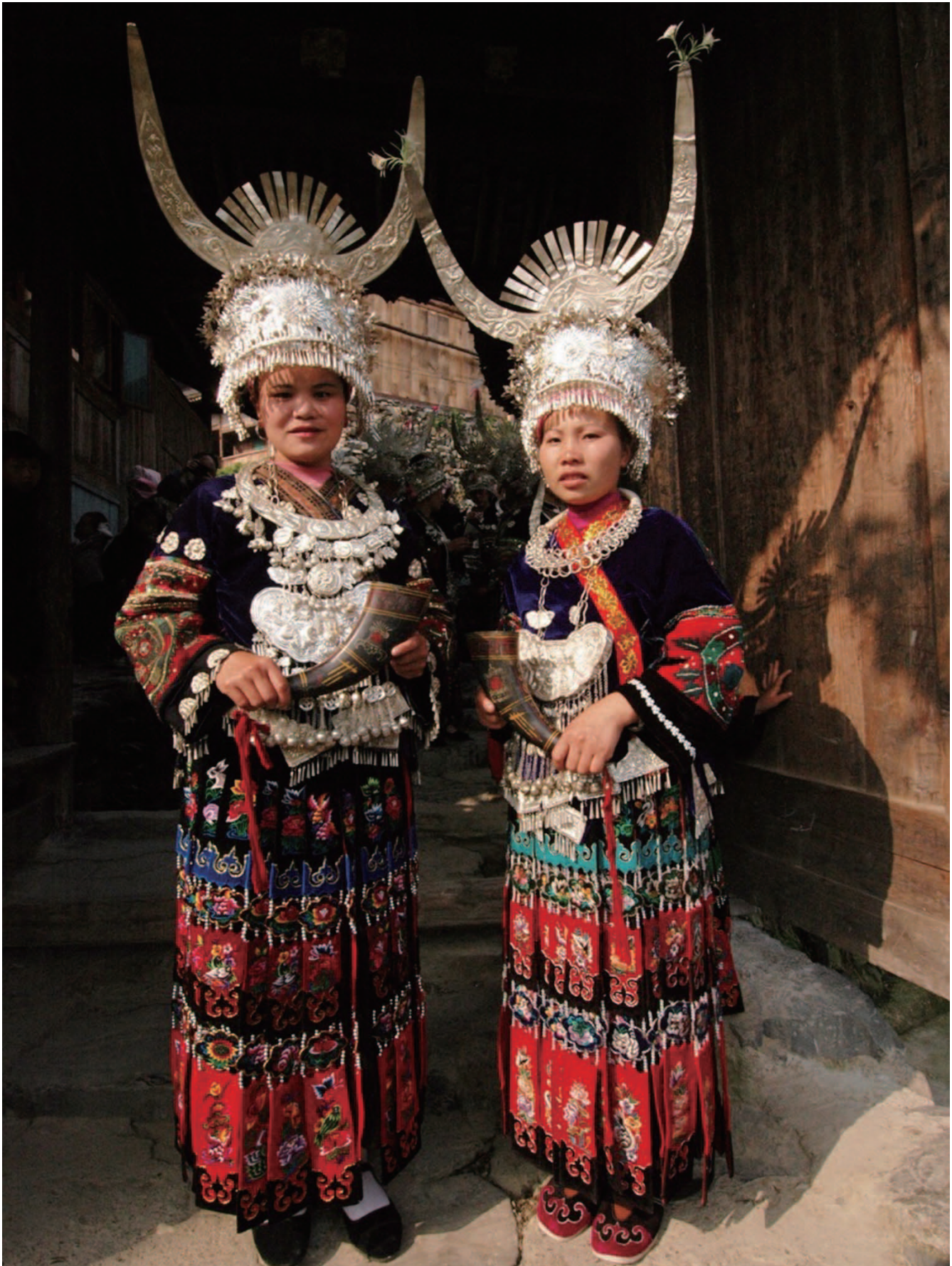
「盛装した苗族の女性」2010年5月 貴州省凱里雷山県にて 馮学敏(中国写真家協会会員・日本写真家協会会員・世界華人写真家連盟副会長)

日中文化交流市民サークル「わんりい」 東京都町田市能ヶ谷7-32-12 田井方 〒195-0053 TEL&FAX:042-734-5100 http://wanli-san.com/ Eメール: wanli@jcom.home.ne.jp ◆「わんりい」HPのアドレスが上記になりました。