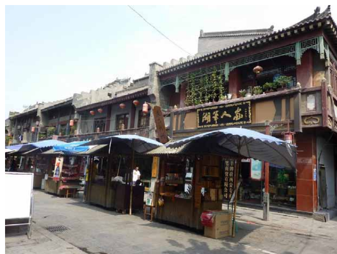
印鑑彫りの露店などが並ぶ碑林付近の様子

4日間でタクシーに乗ったのは1日目の西安長距離バスターミナルから西安賓館、4日目の西安賓館から西安駅の2回だけだった。大きなトランクやリュックを持つての移動がたいへんだったからだ。それ以外はすべて路線バスと徒歩だった。だが西安のタクシー料金は日本よりずっと安いし、時間も短縮できるから無理してバスに乗らないで、タクシーを使ったほうが良いかもしれない。