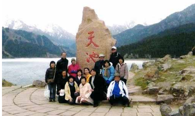
天池の前で記念撮影

翌日、ウルムチ市の北東約100kmのところにある「天池」に向かった。朝8時にバスが出発したが途中から道路は舗装されておらず、凸凹道が続く。バスは常に左右に揺れ、時折とびあがるほど揺れたりした。3