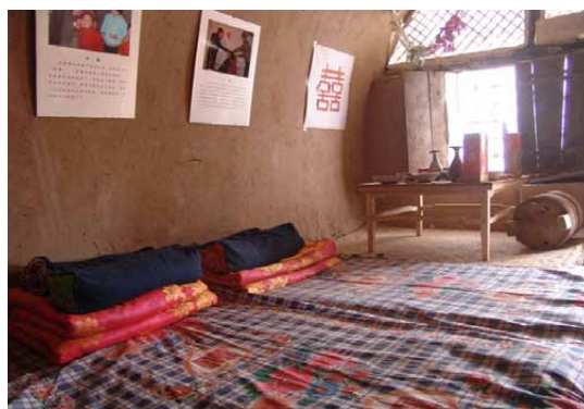
写真3 碾畔博物館の中