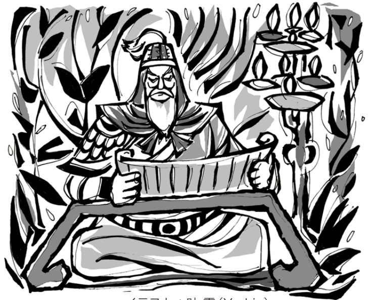
イラスト：叶霖 (Ye Lin)

兵達はこれを聞いて、この老将の思慮深さと決断力の素晴らしさに敬服しないものはいませんでした。趙充国は地形を偵察し、さらに捕虜にした敵兵の口から、敵の内部の状況を聞き出し、敵軍の兵力や部署を調べ上げた後、兵を駐屯させ守備を固め、国境を整備しチャン族の策略を分裂瓦解させる計画を立てて、宣