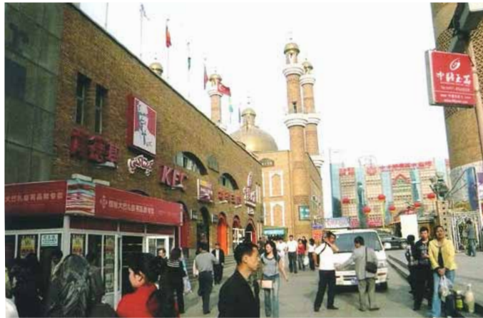
国際大バザールというショッピング街

自治区といっても政治経済の主要ポストは漢民族が握っているのだから「自治区」とは名ばかりである。