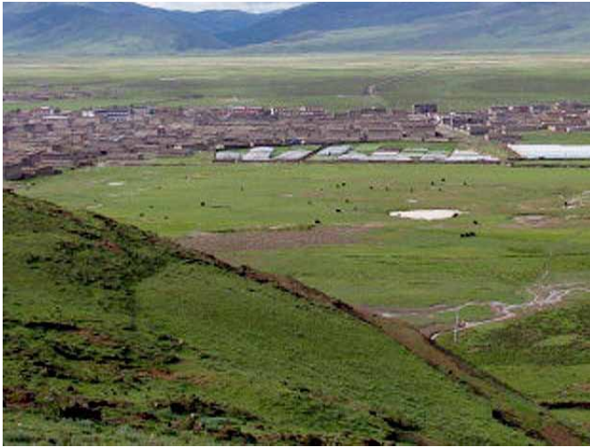
街外れの小高い場所から見た、理塘市街地の風景