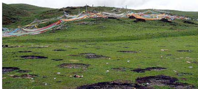
祈祷旗が立つ鳥葬場に連なる丘

腰から下全部を覆う大きなエプロンをつけた鳥葬師は鉈をふるい、あの日私が腰掛けそうになっていたのと同じ様な石の上で、丹念に骨を砕き肉を刻む作業を続けてい