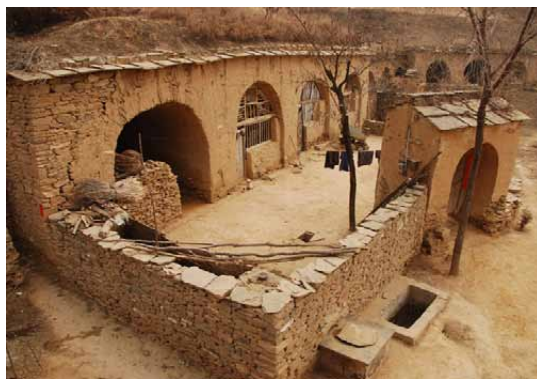
写真2 古い村をそのまま利用した碾畔博物館

の多くの村々、山々をめぐり、くまなく調べあげた。役人が「一つ一つの山丘にどんな意味があるというのです？」といぶかしがると、靳先生は「山の中に入り込むと、山は見えず。君たちは君たちの土地をまだ知らない」と軽やかに答えた。「エジプトのピラミッドにもアメリカのグランドキャニオンにも行ったが、ここの素晴らしさにはかなわない」。それ以来、彼はこの地を第二の故郷として、毎年訪れるようになった。2001年だけでも半年あまり滞在し、油絵を描くとともに、古い村々や墳墓の調査を重ね、民間芸術や土地の習俗を記録した。こうしてその年の年末、県政府の協力を得て、小程民間芸術村の創立に至ったのだ。