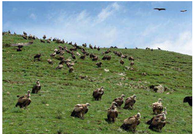
ハゲワシの待機風景

鳥葬などわざわざ見に来る程のものでもないのに、といった雰囲気だ。その男の言葉につられて仲間の男達も苦笑している。私は不思議でたまらなかった。その場にいる誰一人として悲しそうな顔をしている人はいないし、故人を偲んでいる様子も無い。鳥葬場の方へは時折目を向ける程度で、儀式の進行状態にもさして興味が無い様子だ。彼等の言葉は解らなくても、その雰囲気から話されている会話は単なる世間話をしている様にしか見え、鳥葬場に背を向け寝そべて寛いでいる者さえいた。いくら日本と文