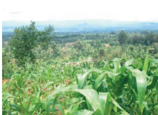
アバディア国立公園を望む