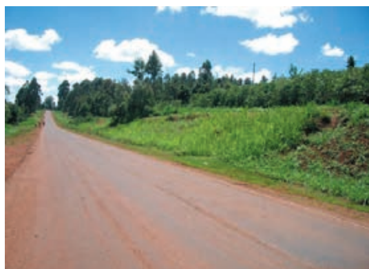
ナイロビへと続く道