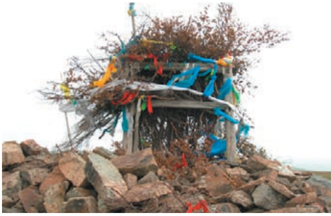
山頂のオボ神を祭る石塚(オボ)

に、ビール、白酒の応酬の内に、歓迎パーティが始まった。我々は大いに話し、大いに食欲を満たした。