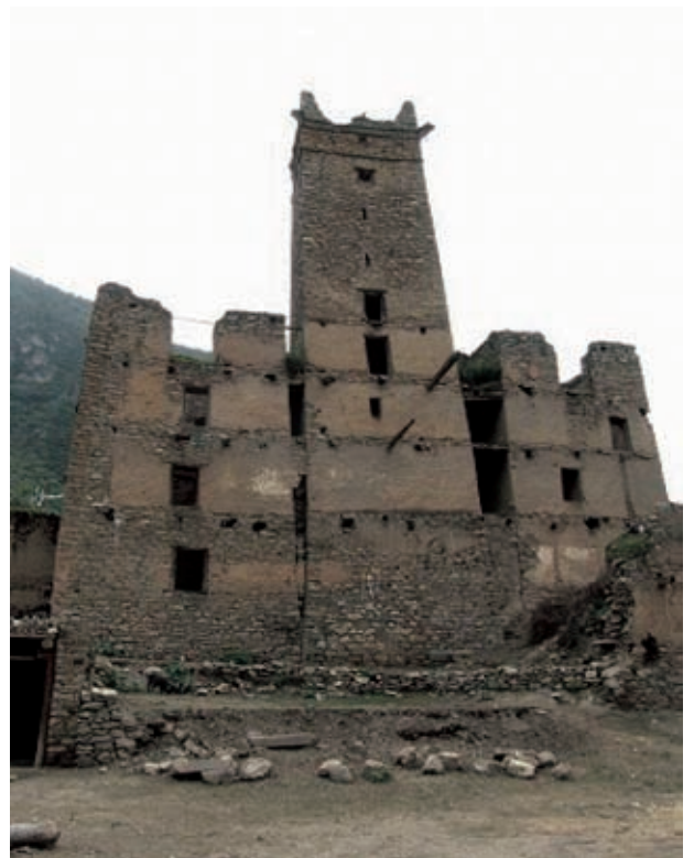
石積みチベット建築

さて、まったくの無知で始まった旅ながら、すばらしい案内人・大川氏のおかげで多少なりともチベットの歴史、文化に触れることができたのは幸いだった。山の上にそびえる領主の館。この領主は中国革命のとき、八路軍に取り入って命脈を保つたらしい。また、由緒あるチベット仏教のお寺。ここにはすばらしい壁画が保存されているが、文化大革命の際にはお坊さんたちが壁画の前に経典を積み上げて何とか隠し通し、破壊から救ったとか。いずれも悠久の時間の中でゆっくりと朽ちていってはいるが、かつては喜び、恐れ、祈りなど、人間の営みが渦巻いていた場所なのだろう。そして伝統的な石造りながらも今も使われている農村の家々。屋上から女の子が「おかあさーん」と呼びかけている。