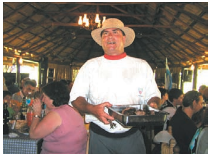
アルゼンチン名物アサード(牛肉の炭火焼き)、熱いうちにどうぞ!

ヨーロッパからの移民が築いた街フエノスアイレス、南米の他の国との大きな違いは移民による白人社会ということ、先史遺跡もみあたらない。南米にありながらヨーロッパらしくありたいと町並を造ってきたアルゼンチンの人々。明日はどんなアルゼンチンを見せてくれるのだろうか……。