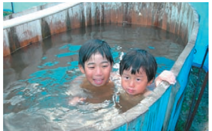
草原で昼風呂を楽しむ