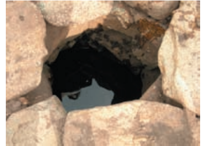
モンゴル松に水をやるための井戸