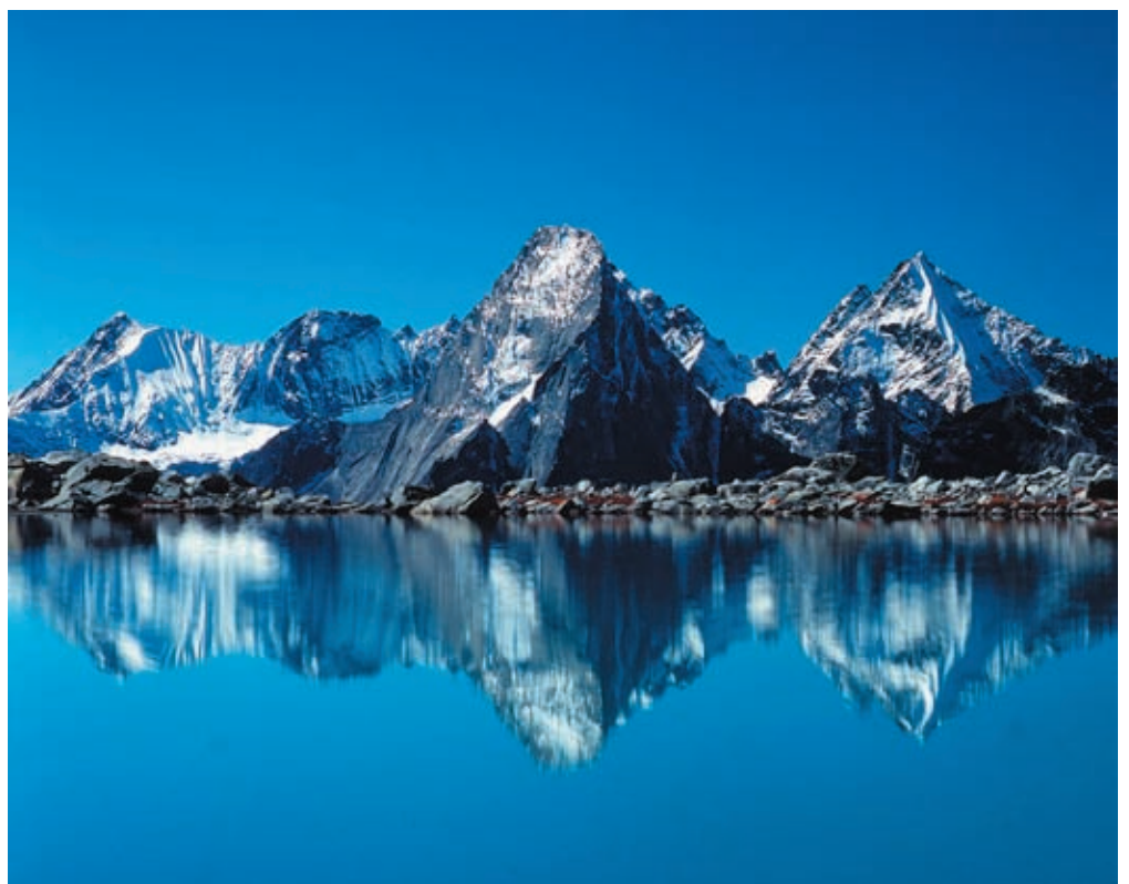
写真2 四姑娘山の主要な山岳美はアルプス型(四川省)