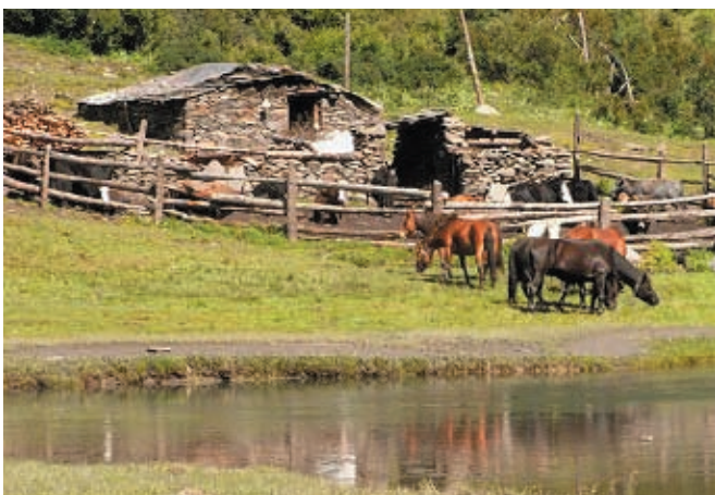
キャンプ地の隣接地は馬の放牧場だ