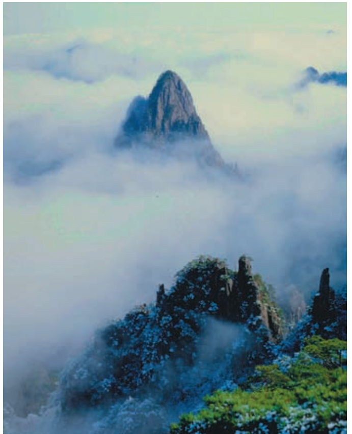
写真1 中国の伝統的な山岳美の黄山(安徽省)

注)「黄山型」や「アルプス型」の言葉は説明のために便宜的に付けた名称で、広く認知されている名称ではありません。