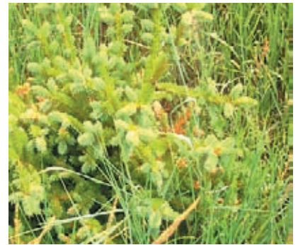
縦横に繁茂しているモンゴル松