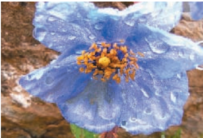
幻の高山植物・青いケシ

キャンプサイトはヤクの放牧小屋の隣に作られた。石を積み上げて作った小さな小屋の中はいろいろで暖かく、皆ほっとしたように火にあたっている。小屋の主人がいろりにかけた大なべで手際よく料理を作り、おいしそうな匂いが漂ってくる頃には小屋は満員。家の人も、関係ない人も料理の分け前にあずかっているらしい。電気洗濯機を回して作ったバターやヨーグルトも供された。そして誰もが大声で、楽しそうにおしゃべりをしている。なにもない、けれどあたたかい、そんなチベットのくらしを垣間見た今回の旅だった。